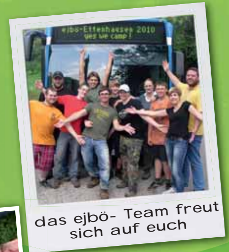
das ejbö- Team freut sich auf euch