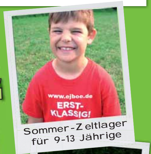
Sommer-Zeltlager für 9-13 Jährige