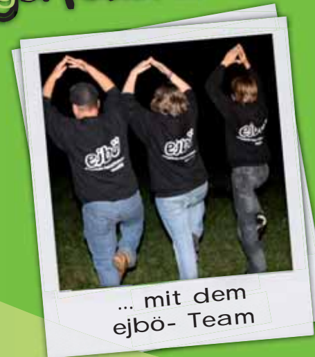
... mit dem ejbö- Team