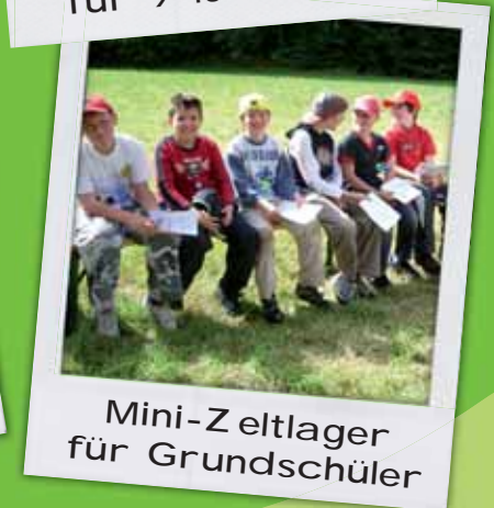
Mini-Zeltlager für Grundschüler