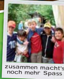
zusammen macht's noch mehr Spass